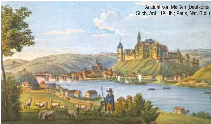
Ansicht von Meißen (Deutscher Stich, Anf., 19. Jh.; Paris, Nat. Bibl.)

Annäherung an jedes beliebige Thema, welches er aufgreift und zu welchem er sich äußert; zum zweiten erweisen die obigen Zitate, dass er am Beginn seiner ärztlichen Tätigkeit voll in der Tradition der von Descartes ausgelösten rationalen Denkschule verwurzelt ist, die sich ja vor allem in einer vorwiegend materialistisch-mechanistischen (und damit idealistischen) Sicht der Lebensvorgänge kundtat, und die aus ihrem Ansatz heraus zu einer rasanten Entwicklung der quantitativen Seite der physikalischen und chemischen Wissenschaften geführt hatte. Dieses Denken griff auch auf die biologischen und humanen Wissenschaften über und führte zu den Denkschulen der Iatrochemiker und Iatrophysiker. Doch schon in diesem frühen Stadium seines beruflichen Werdegangs sind ihm, trotz aller iatrophysischen und iatrochemischen Prägung der stark mechanistischen-rationalistischen Ausrichtung seines Denkens, die wesentlichen Grundvoraussetzungen eines vorurteilsfreien Denkens keineswegs fremd.