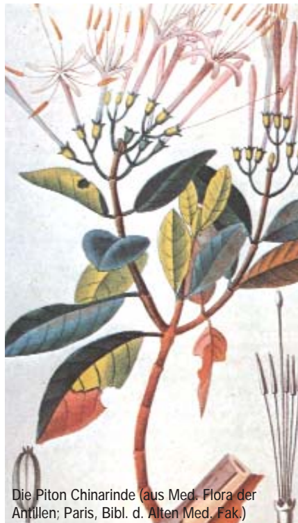
Die Piton Chinarinde (aus Med. Flora der Antillen ; Paris, Bibl. d. Alten Med., Fak.)

Gleichzeitig hatte er sich auch bereits damals von allen gängigen medizinischen Vorstellungs- und Erkenntnismustern distanzieren gelernt, er war keiner medizinischen Schule und ihren Denkstrukturen mehr bleibend verpflichtet, dadurch offen und vorurteilsfrei. Seine intensive Übersetzungstätigkeit und seine großen Sprachkenntnisse hatten ihm die ganze damalige europäische Fachliteratur erschlossen, von den alten Griechen bis in seine Zeit, er kannte auch die für die medizinische Wissenschaft am meisten versprechenden neuen Ergebnisse in den anderen Einzelwissenschaften, besonders der Chemie, Pharmazie, Botanik, Zoologie. Dazu kam noch seine umfassende klassische Ausbildung, er hatte die beiden wichtigsten Philosophen im Original gelesen, er kannte die Dialektik eines Platon wie auch die logischen und metaphysischen Schriften eines Aristoteles und war damit auch mit den Möglichkeiten analog, d.h. finalen Denkens vertraut. Durch seinen Selbstversuch hatte er, sicher vorerst unbewusst, die Lücke zwischen einer theoretischen Behauptung über das Wesen einer Arzneiwirkung (es könnte die Wirkung x des Arzneimittels auf diese oder jene Eigenschaft zurückgeführt werden) und einer Erfahrung von Arzneiwirkung