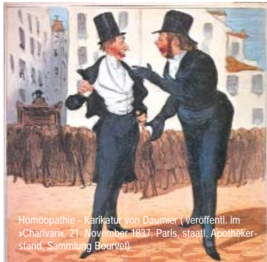
Homöopathie - Karikatur von Daumier (veröffentl. im »Charivari«, 21. November 1837; Paris, staatl. Apothekerstand, Sammlung Bourvet)

Diese Zitate, die sich fast beliebig vermehren ließen, zeigen uns hier zwei wesentliche Aspekte für die Beurteilung des jungen Hahnemann : Zum einen seine umfassende